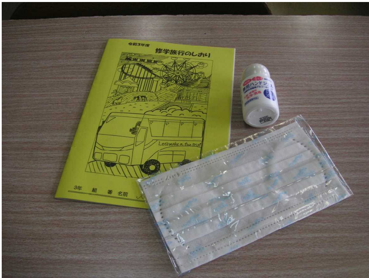
マスクと消毒用ハンドジェルは修学旅行の必須アイテム。(ジェルは初日に生徒全員に配布)(10月8日)