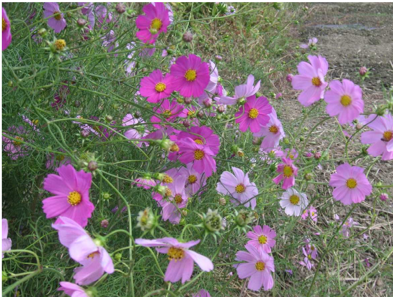
揺れるコスモス — 修学旅行先ではどのような風景が広がっているのでしょうか。(10月3日 学校近くの通学路)