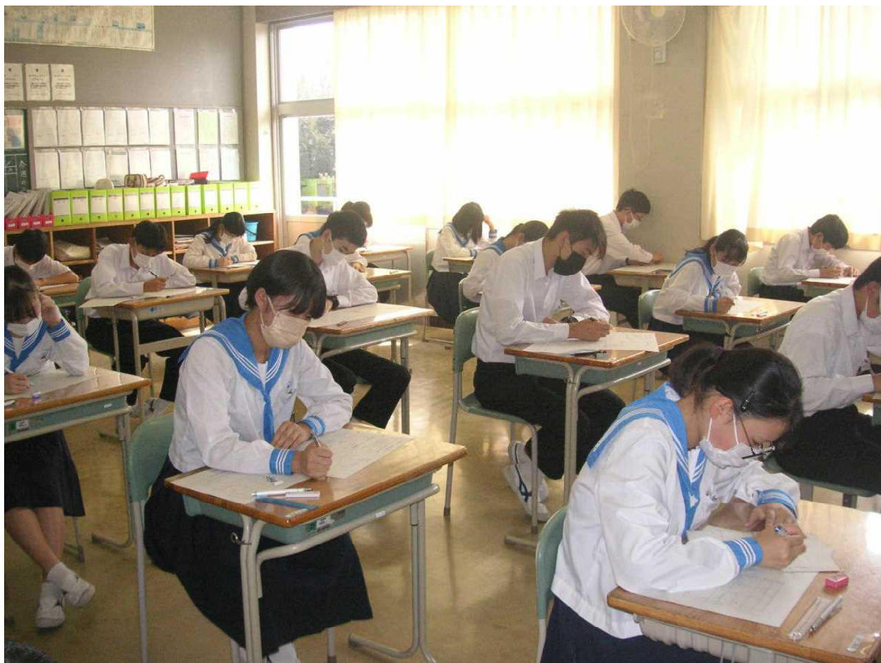
中間テスト4時間目は数学です。(3の2 9月30日)

いわき市に出されていた「まん延防止等重点措置」が本日午前5時に解除されました。7月後半から急増した感染者数に、不安の尽きない2か月間を過ごしてきたことと思います。