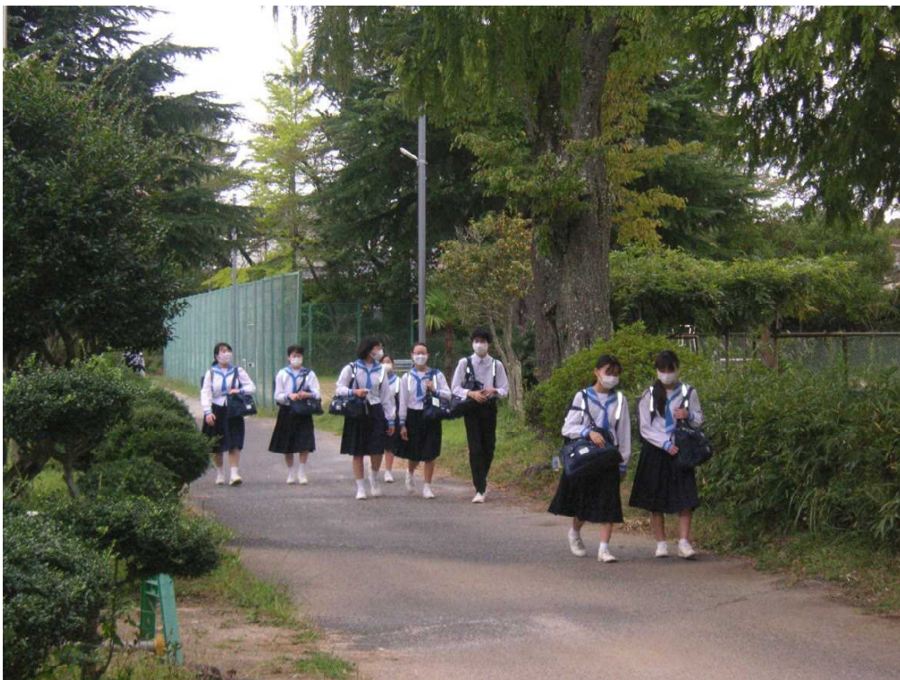
来週から衣替え — 中学校の夏服着用も今週のみ。(9月27日 朝)

「ゴン攻め」「鬼〇〇」— 夏の東京オリンピックやパラリンピックで話題になった言葉の1つです。印象に残っている人も多いのではないのでしょうか。解説者の繰り出すこれらの言葉が、新しい競技のスピード感や楽しさに相応しく、なぜか競技に親しみを感じてしまいます。