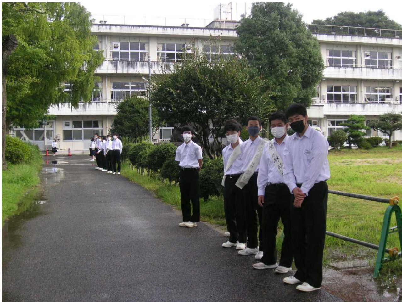
後期生徒会役員立候補者が、登校する生徒に投票を呼びかけます。(9月16日 朝)