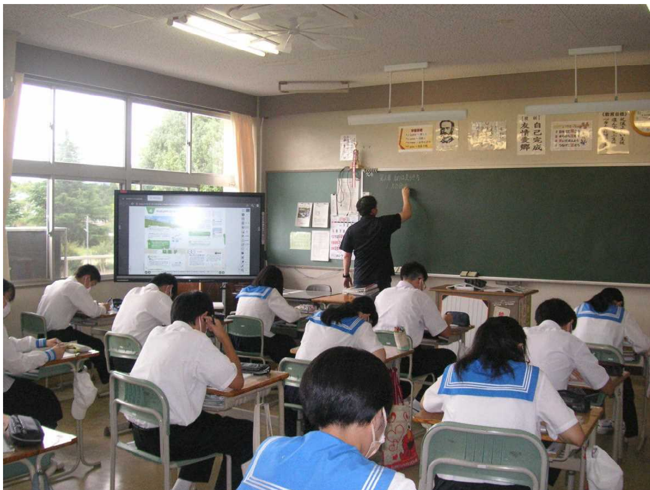
電子黒板などのICT導入により、様々な映像提示が可能となりました。(3の2 理科 9月13日)

いわき市に出されていた「まん延防止等重点措置」が、9/13より9/30まで延長されました。そのため、中学校では感染防止に留意したこれまでの学習形態や給食活動が継続します。(1、2年生の部活動は時間を短縮して実施)