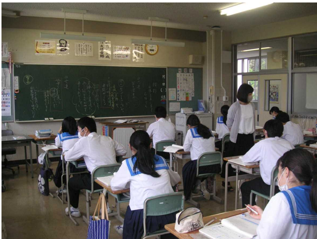
石垣りんの詩を通して、物事の見方や考え方を深めます。(3の2 国語 9月9日)

来週、二者相談を実施します。当初予定していた夏休み明けの1週目は3校時で下校となりました。そのため2週遅れの相談となります。