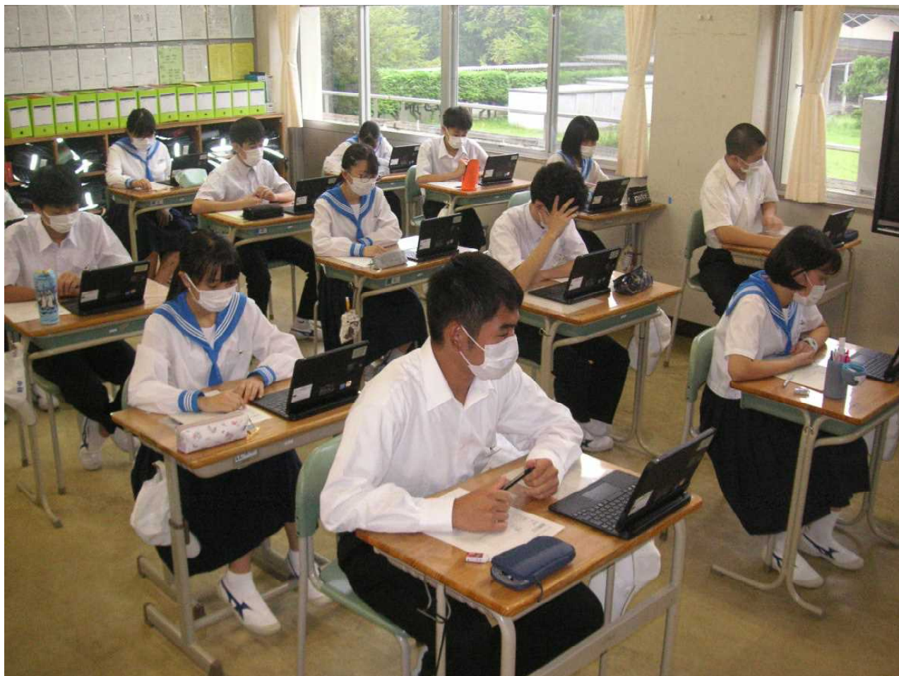
1人1台配布されたタブレットを初期化する作業を進めます。(3の3 9月1日)

「〇ギガもある」—— スマホなどの通信量でおなじみのギガ(giga)の言葉。1、2年前ぐらいから学校現場でも同じ言葉が使われています。「GIGA スクール構想」です。同じギガでもこちらは「 G lobal and I nnovation G ateway for A ll」の頭文字をとったもので、「すべての子どもたちに、グローバルで革新的な入口を」という意味と説明されています。