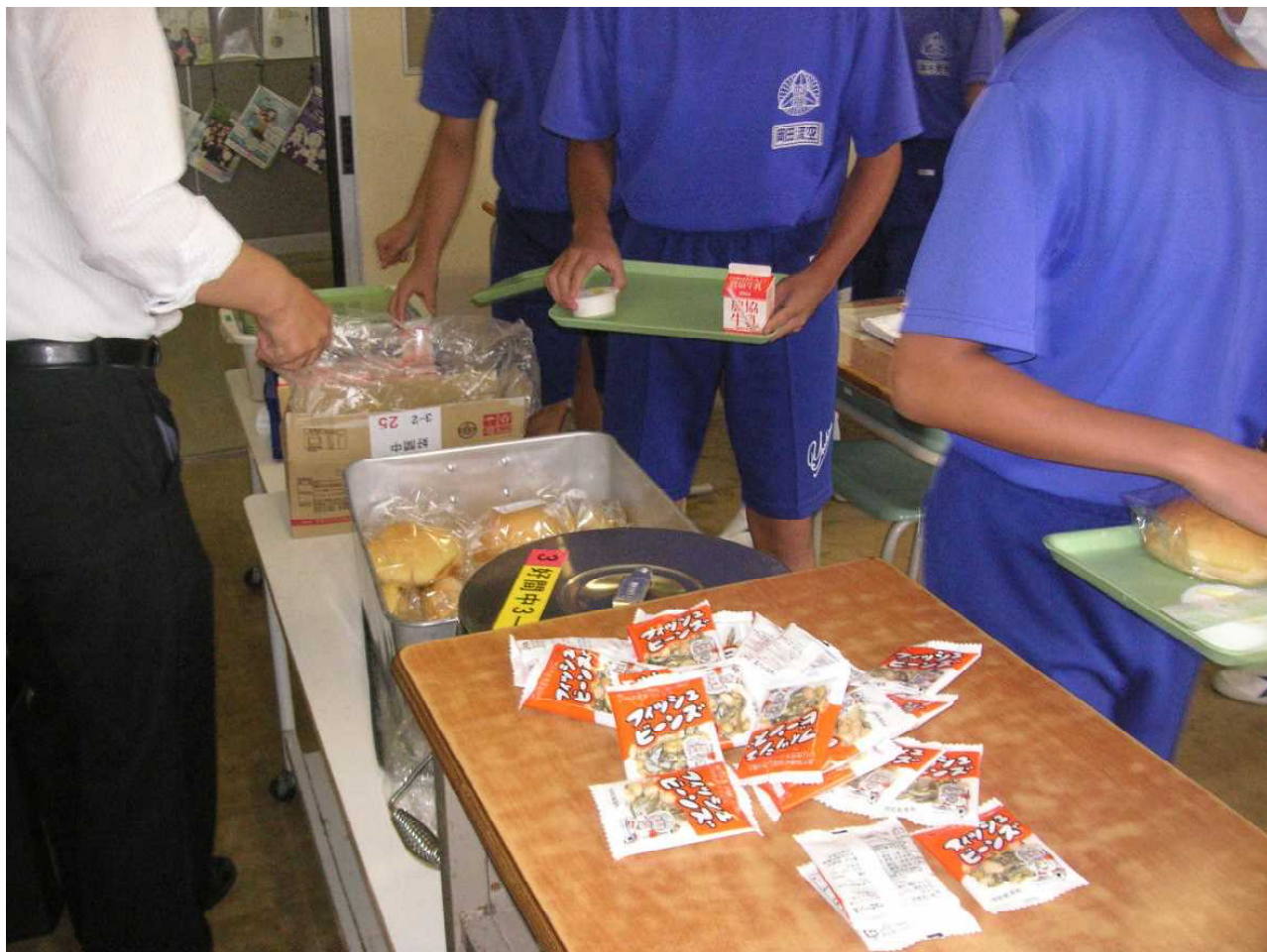
コロナ感染防止の一環として、簡易給食が始まりました。(3の2 9月1日)

9月5日はいわき市長選挙の投票日です。 先日、選挙管理委員会のある東分庁舎で期日前投票をしてきました。