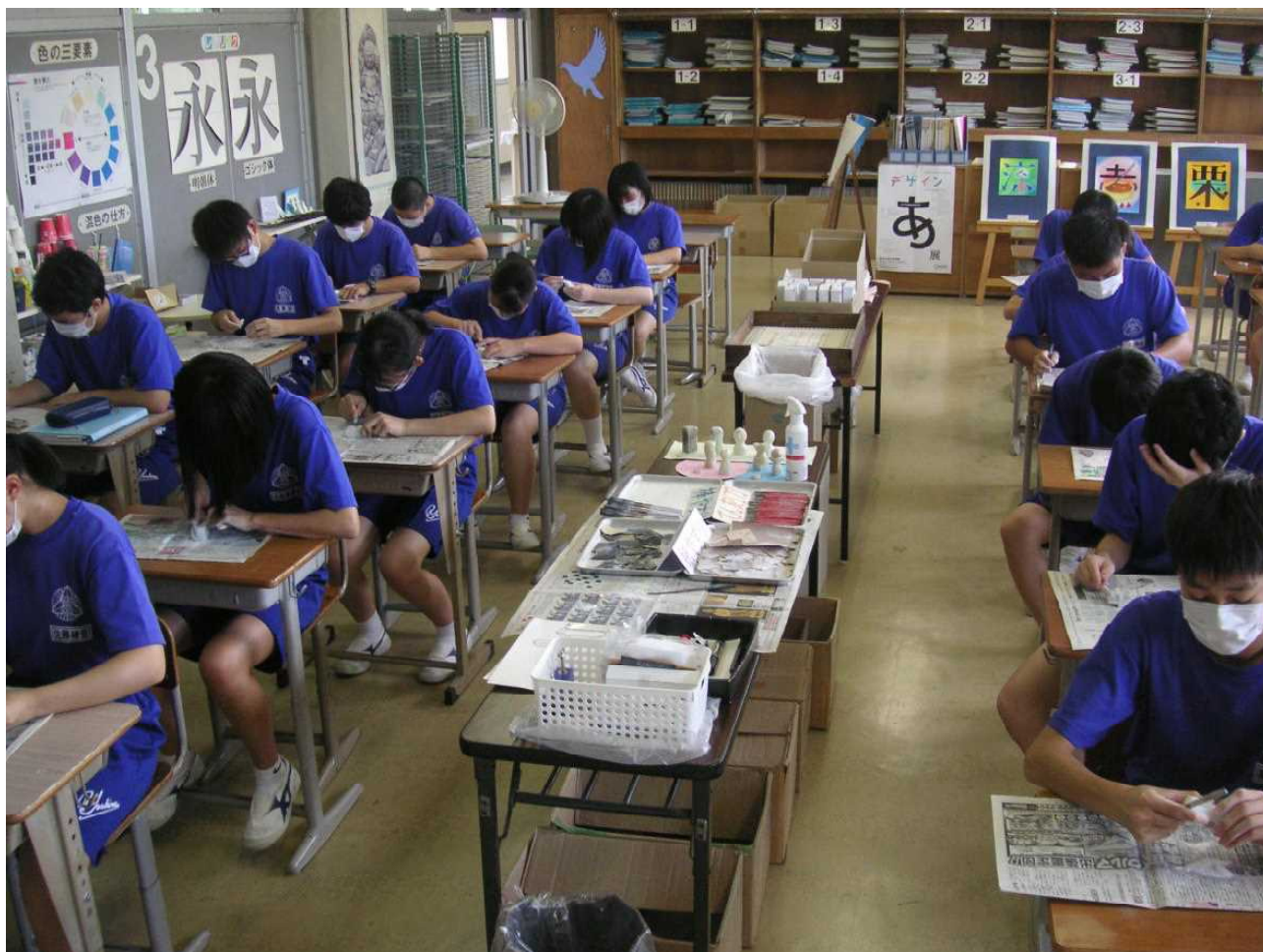
マスクをつけ前を向いての制作が続きます。(3の3 美術 8月30日)

夏の体験入学で私が担当したのはS高。集合時間よりかなり早く高校に着くと、既に好中생が1人待っていました。その後、強い日差しが朝から照りつける中、中学生がぞくぞくと体育館前に集まってきました。