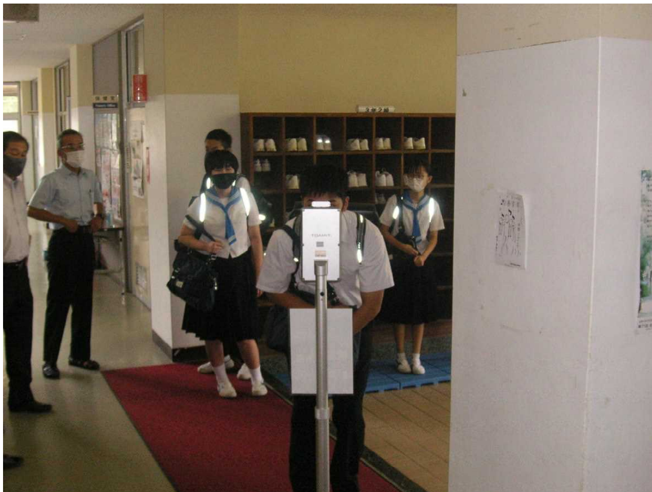
昇降口のサーモカメラで検温し、体調を確かめます。(8月26日 朝)

私たちの住む街が「まん延防止等重点措置」の対象地域となり 20 日余りが経ちます。全国的にも感染者が急増し、多くの都道府県が緊急事態宣言やまん延防止の対象になっています。そのような中で2学期が始まる学校。更なる感染拡大が危惧されると連日報道されています。