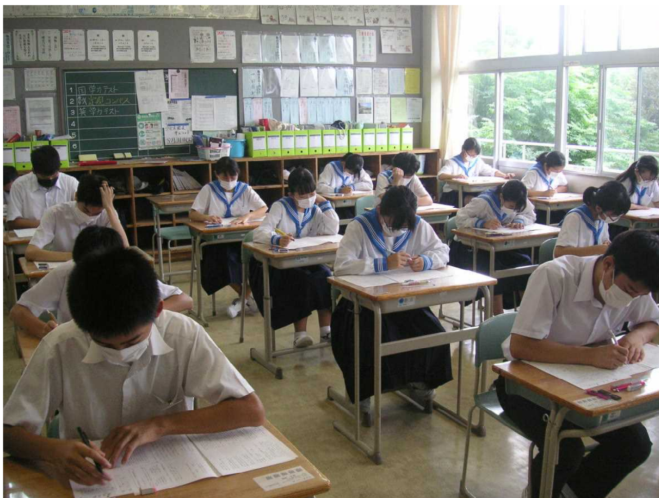
2回目の学力テスト — 初日は国数英の3教科に取り組みました。(3の1 8月26日)

学力テストの2日目が終了しました。出来具合は？ すぐに自己採点したいところですが、1週間後にお預けです。他校の実施日が違うため、どの中学校も問題用紙と模範解答を9月2日まで学校側で保管するためです。志望校を決める大切な資料の1つとなる学力テスト。3年生の場合は実施方法も厳格になります。