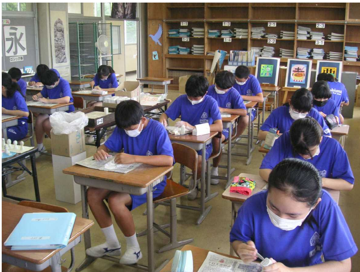
美術では石を彫って印をつくるてん刻制作に取り組んでいます。(7月14日 3の2)

デルタ株が急増している。東京都に4回目の緊急事態宣言が発令。減らない人流。東京オリンピックが無観客に。小さな子どもが初めて重症化した…。