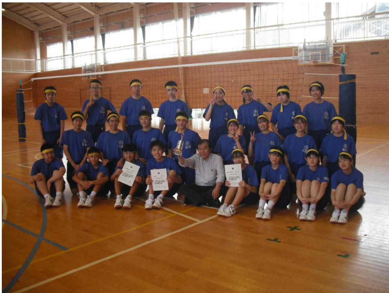
3年2組 — 男女とも1位、そして総合1位!! (7月9日 スポーツ大会)

今年も学年通信を担当しています。発行の目安は月水金の週3回。私の場合はこんなふうを作成しています。