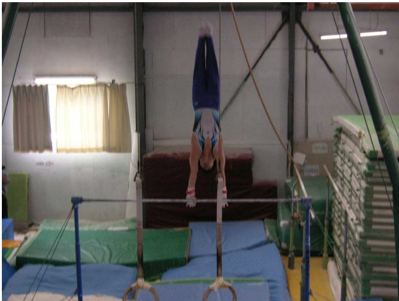
本校生徒の鉄棒演技—爪先まで神経が行き届いているすばらしさ。(6月14日 市中体連体操会場で)