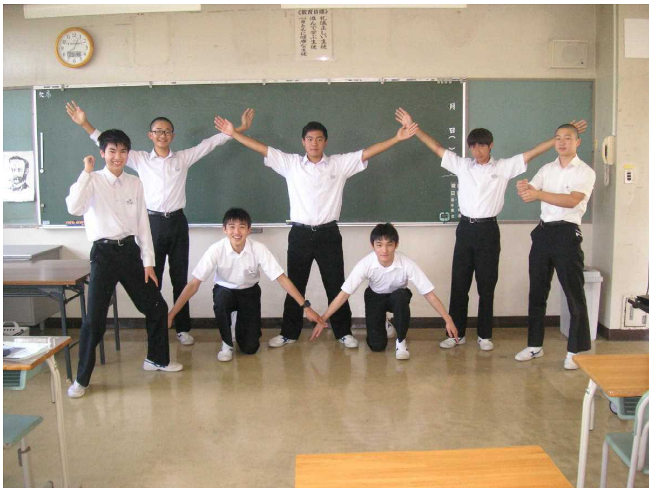
「フレイフレイ 好間！」— 応援団からのエールが聞こえてきます。(6月9日 朝)