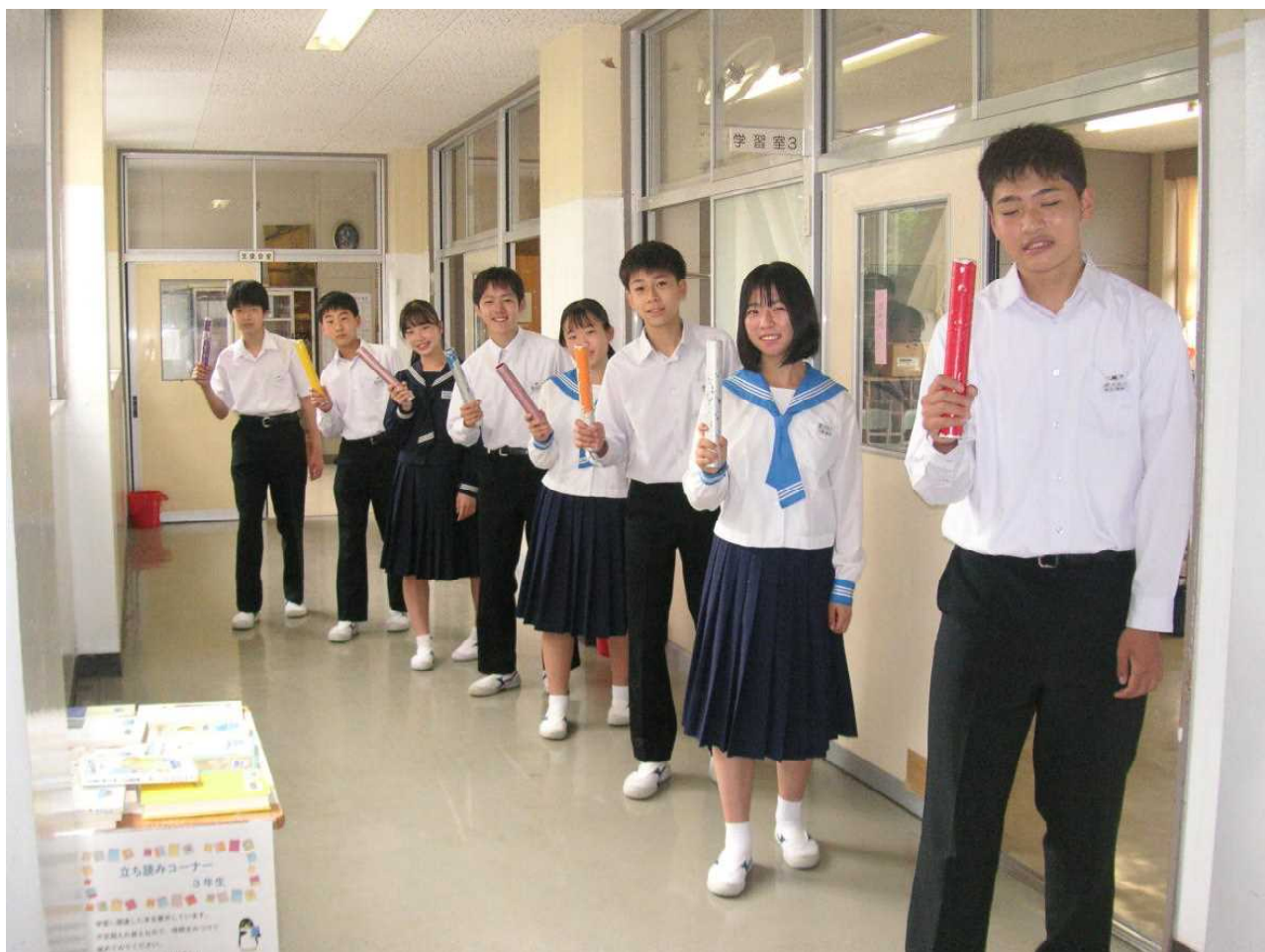
3年生の陸上部員 — 仲間がいたからがんばることができました。(6月2日 朝)