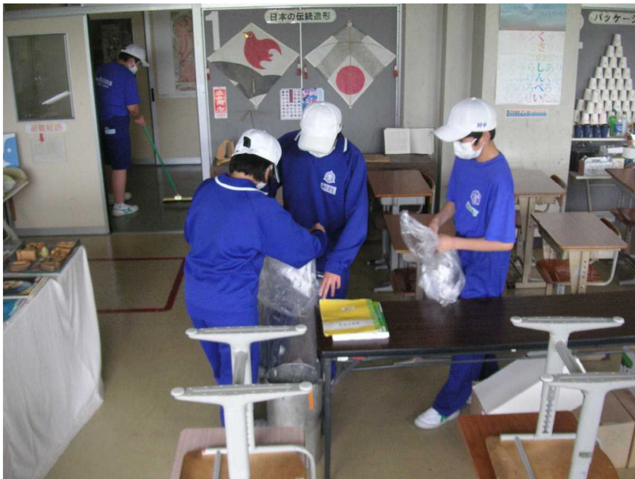
清掃常任委員がゴミを回収します。(5月24日 そうじの時間)

3年生にとって忙しい1週間でした。中間テストや全国学力テスト、市中体連激励会、アルバム写真撮影と毎日のように大きな行事が続きました。気持ちを張りつめ、頑張った1週間ではなかったでしょうか。