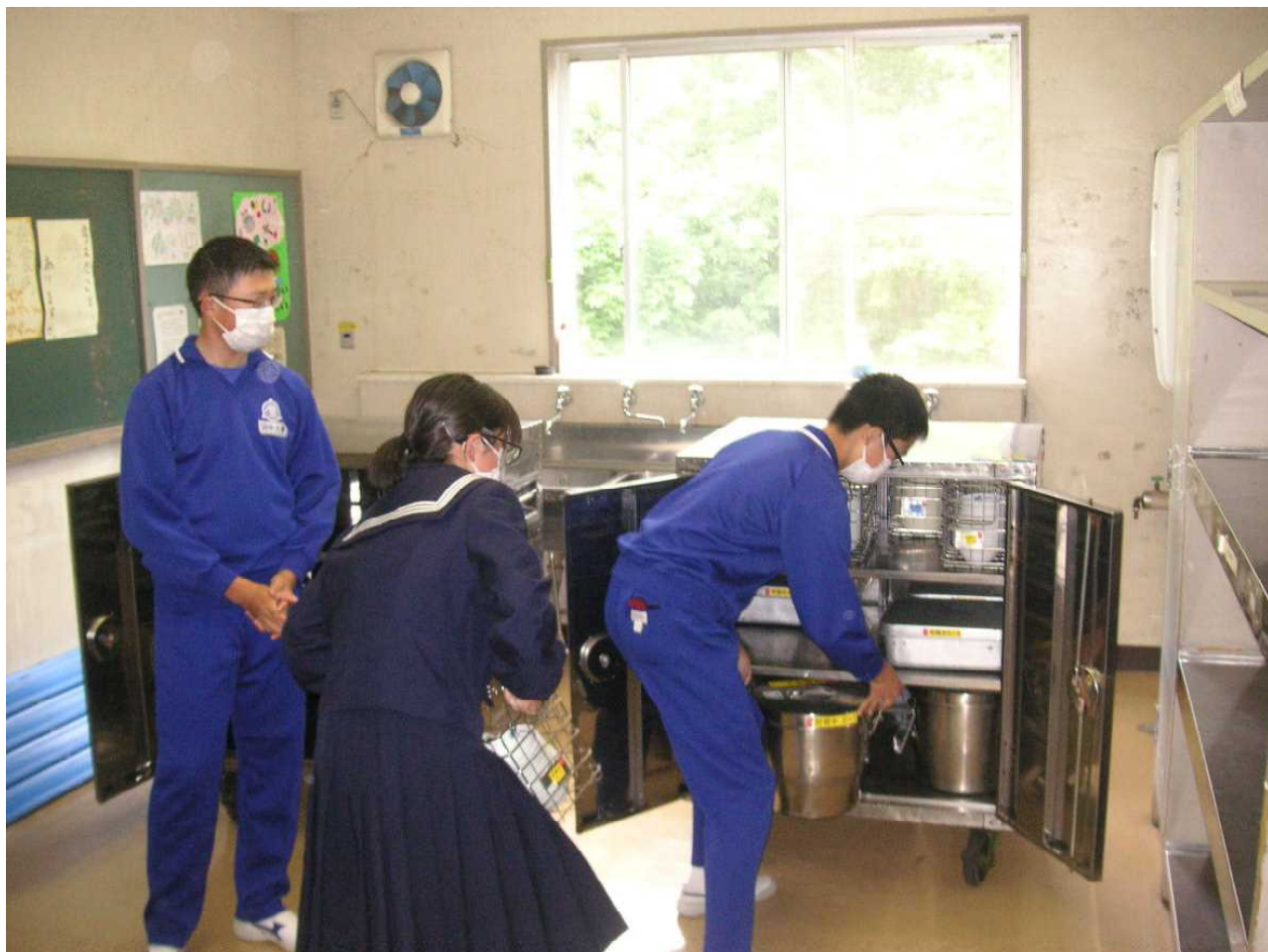
片付けを手助けする給食常任委員。(5月24日 配膳室)