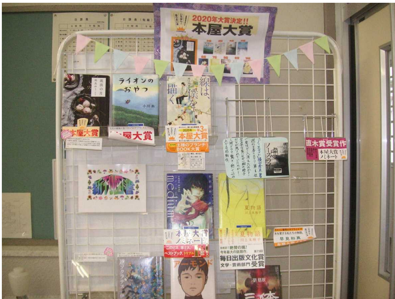
「本屋大賞」— 図書室の人気コーナーの1つです。(5月7日)

「本屋大賞」コーナーが図書室の入口に設置されています。いつも何冊か貸し出し中で、生徒にも教師にも人気のコーナーです。