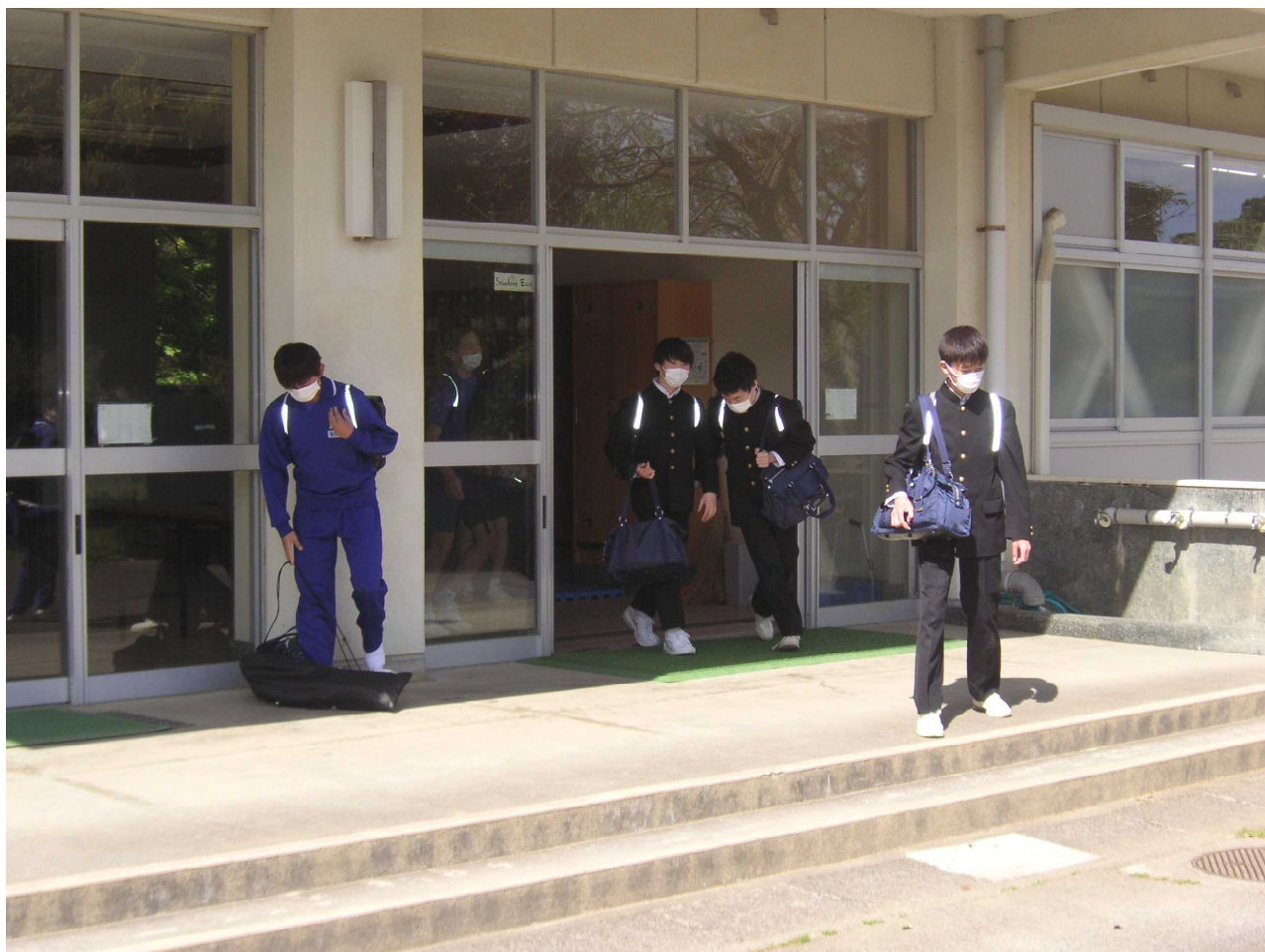
「また明日！」— 下校時も足取り軽く。(4月26日)

いわき市感染拡大防止一斉運動が4月26日から5月16日まで実施されています。市内での感染者が増加傾向にありクラスター発生が相次いでいるためです。