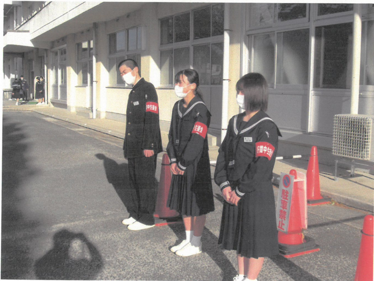
「おはようございます。」— 本部役員の元気な声が響きます。(3月5日 朝のあいさつ運動)