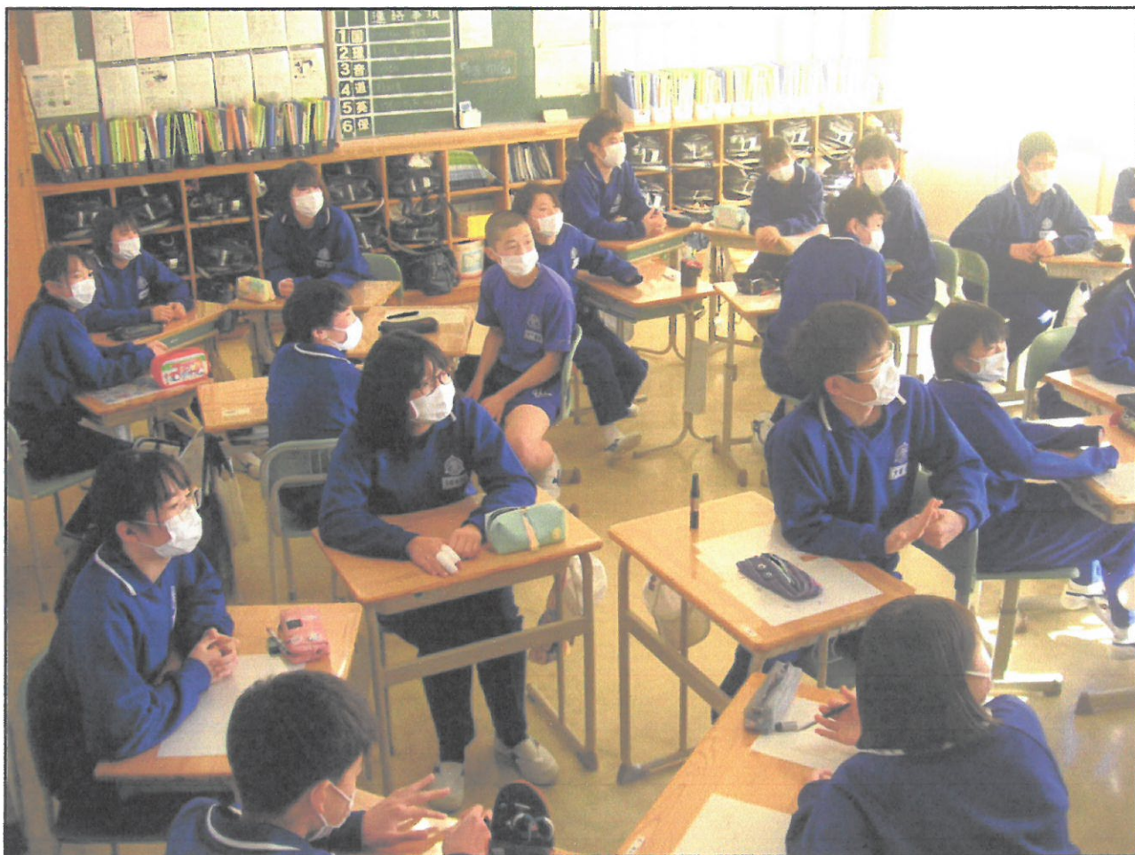
ゲームを通してお互いの距離を縮めます。(2月5日 2の3)

今週火曜日(2/9)正午に県立前期選抜の出願が締め切られました。県教委 HP に出願状況一覧がアップされたのは夕方6時頃です。