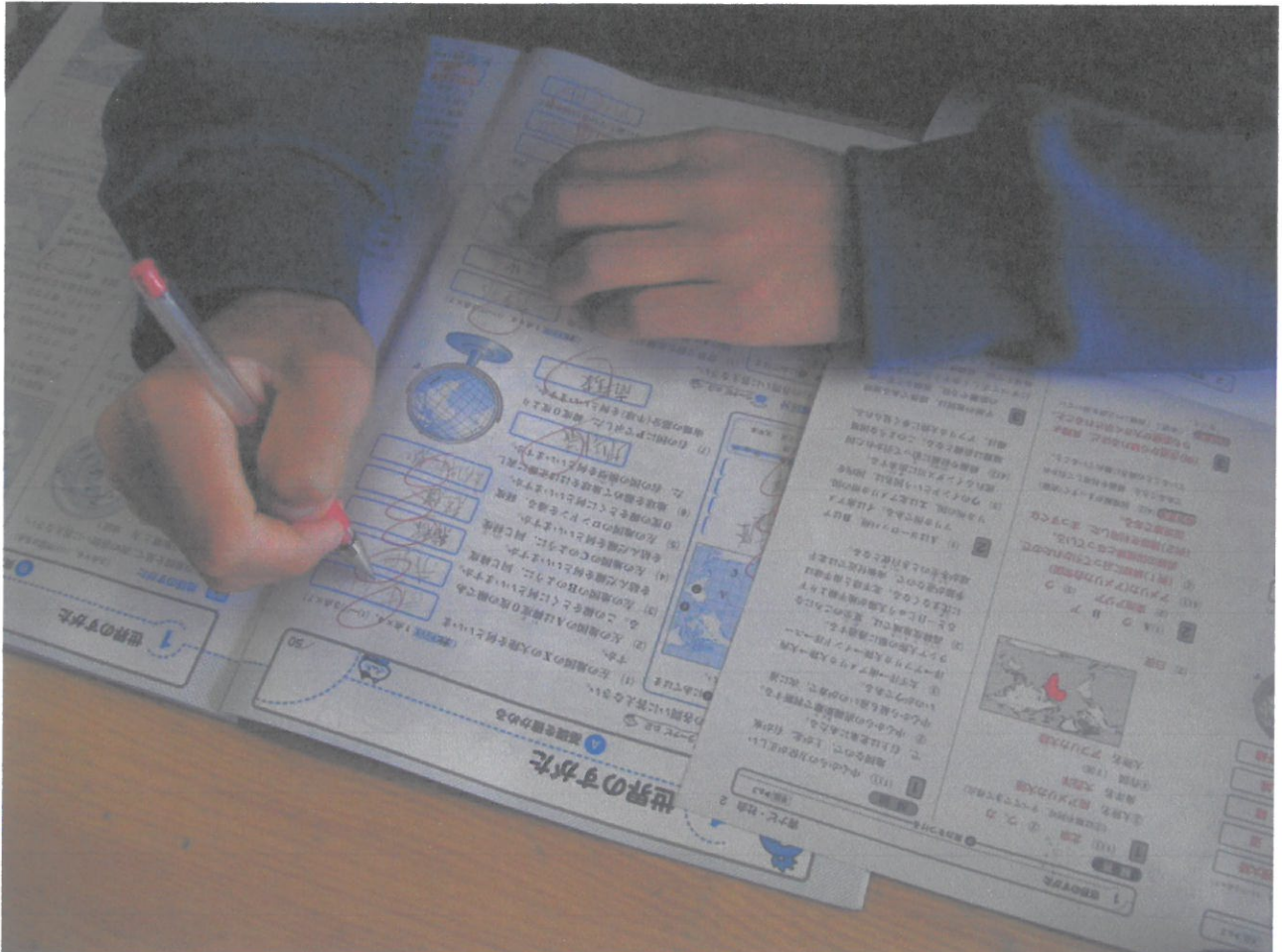
「ま☆ナビ」学習がスタート — 社会の自己採点に取り組みます。(2の1 1月19日)

冬休み明けに登校した生徒達、何か違います。目線が少し上がったような…。「あっ、そうか、身長が伸びている。」たった2週間見ないうちに。中には髪型を変えてイメージチェンジをしている生徒もいます。