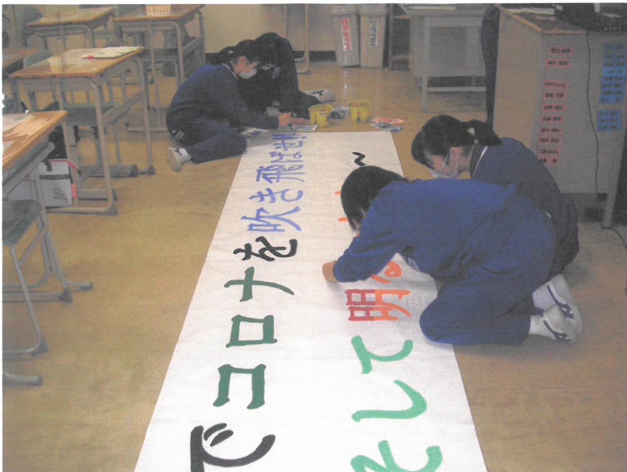
2年生実行委員が学年スローガンを描きます。(10月22日)

「来週は大切な実力テストがある。その重要性を分かっているのかな。」 3学年教師のこんな話が聞こえてきます。