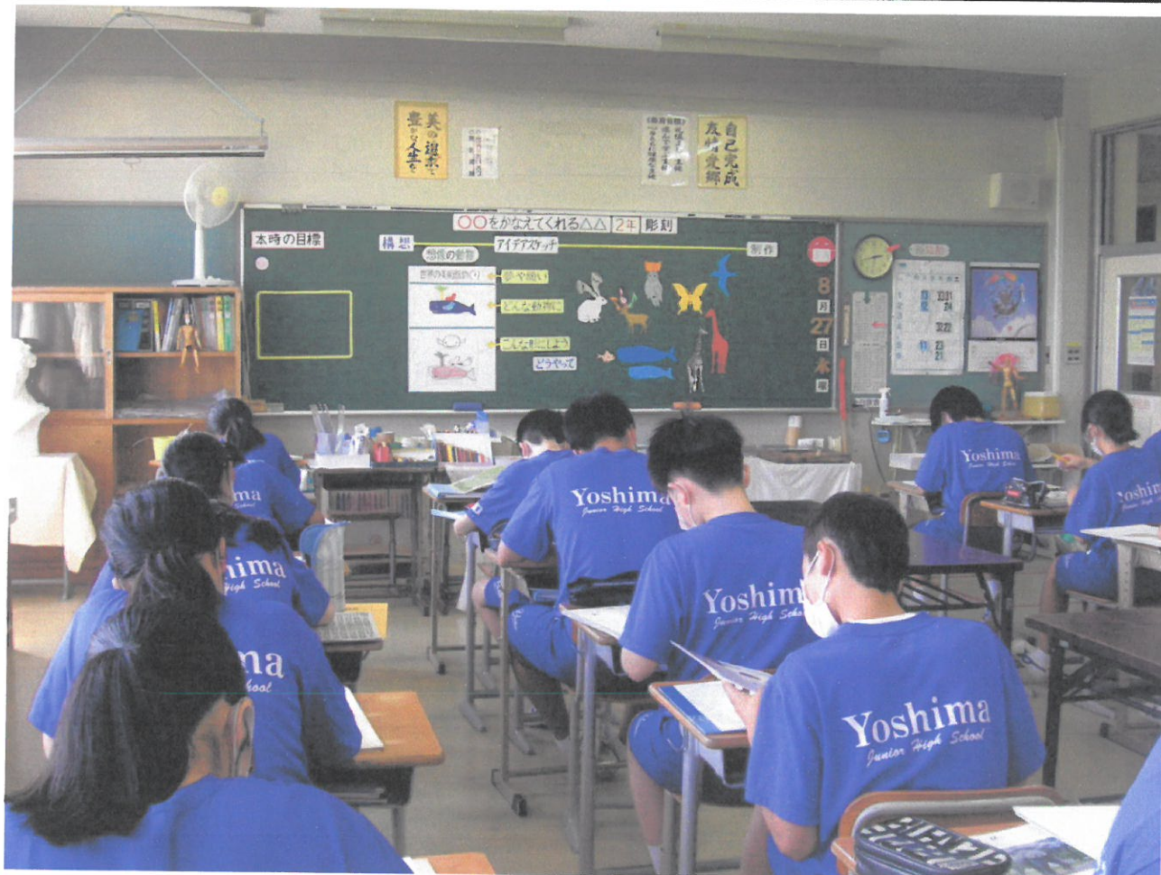
2学期を迎え、美術では新しい題材に取り組みます。(1組 8月27日)