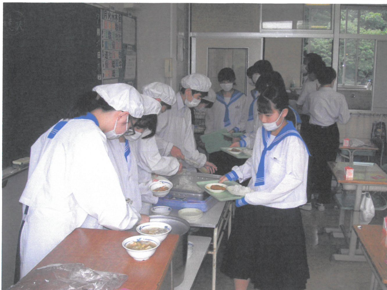
1学期の給食も今日で最後です。(3組 7月30日)