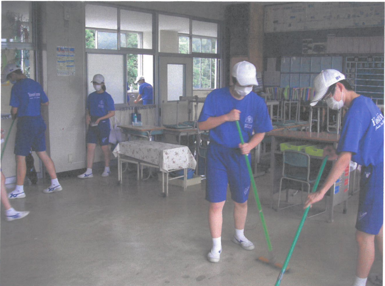
そうじにも真面目に取り組んでいます。(3組 7/9)

今年の梅雨は長雨。屋外の部活は大変です。昨日もぬかるんだ校庭やコートを避け、通路や上校庭など比較的広く安全に活動できる場所を見つけ、今できる練習に一生懸命に取り組んでいました。