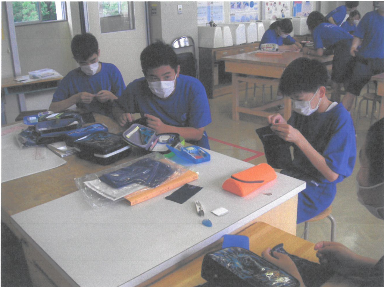
運針の仕方も手慣れたものです。(3組 家庭科)

「目は臆病、手は鬼」—— この言葉が好きです。震災や津波によるがれきの山を前に、どこから手をつけていいのかわからない。絶望だけが広がり途方に暮れる。そんな時期に、ある地方に言い伝えられているこの言葉が紹介されました。どんなに大きな事柄も一夜にして成し遂げることはできない。しかし、手を出して一つ一つ片づけていけばいつかは仕上げる事ができる。現実を前に臆せず立ち上がり、今できることをまずやっつけよう。そんな意味合いが込められています。