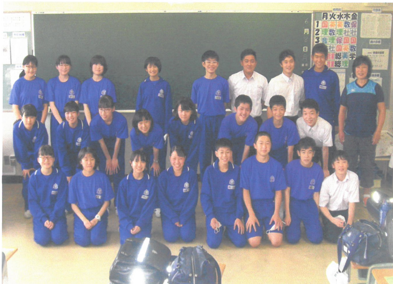
1人1人が輝ける学級に。(3組)

アジサイのきれいな季節になりました。いわきの地も梅雨入り。時折見せる晴れ間に、水に溶けそうな淡い色が映えています。