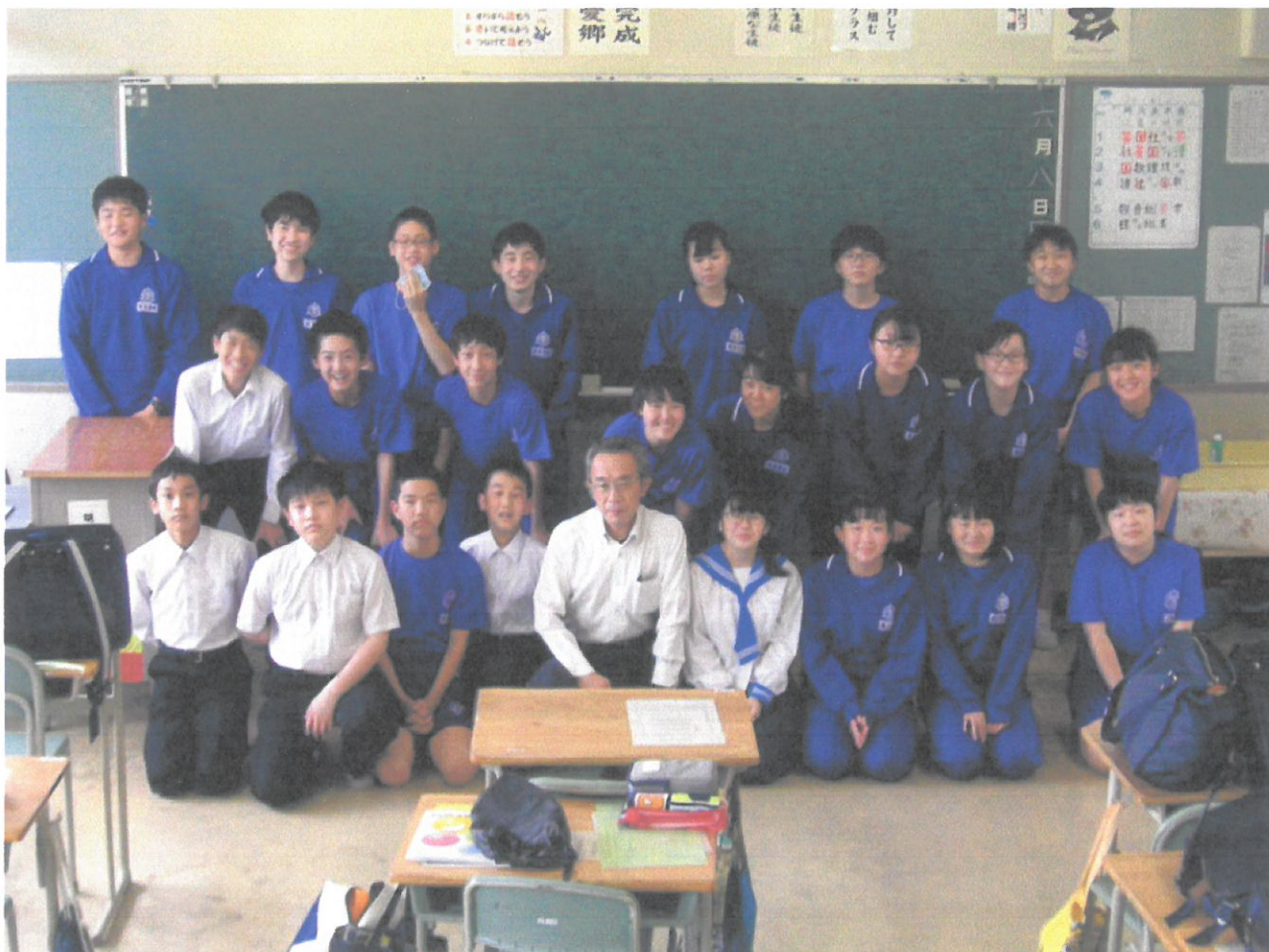
みんなで良い学級にしていこうね。(1組)

「2年生は静かだね。」教科担当の教師からこんな声が聞こえてきます。授業中、質問すると答えるけど、自分から積極的に手を挙げる生徒はまだ限られている。声も低いようです。