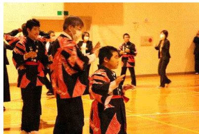
[玲瓏祭]地域交流「川前音頭」