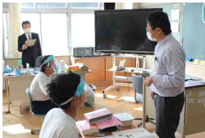
全教科実施した研究授業