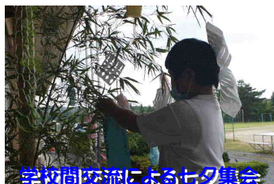
学校間交流による七夕集会