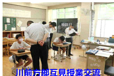
川前方部互見授業交流