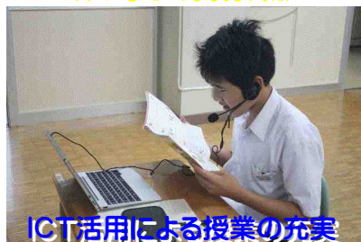
ICT活用による授業の充実