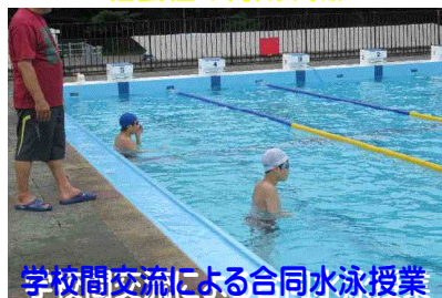
学校間交流による合同水泳授業