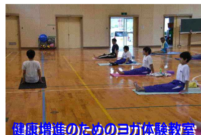
健康増進のためのヨガ体験教室