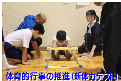
体育的行事の推進(新体力テスト)