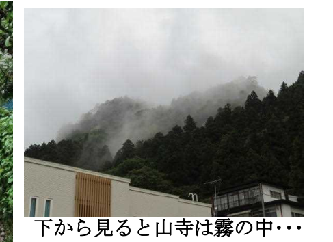
下から見ると山寺は霧の中・・・