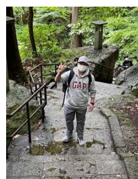
登りの写真は少ないです。生徒たちは元気です。