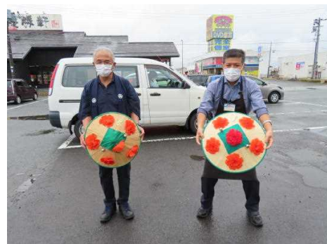
天童タワーと書駒の講師の方が、花笠音頭で見送ってくれました。