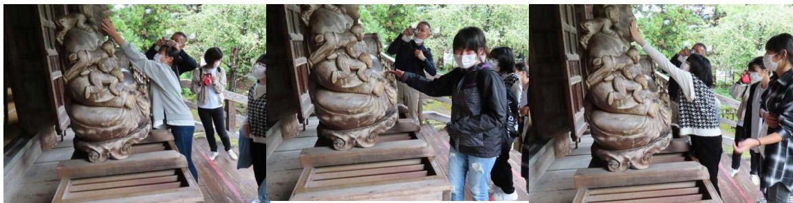
まず、本堂前の仏像でよくなりたく願う所をとこをなでて願掛け。