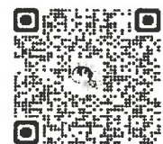
講座申込 QR コード