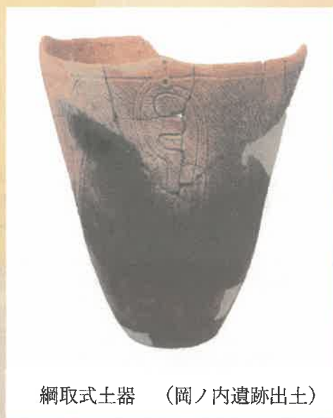
綱取式土器 (岡ノ内遺跡出土)

○ 申し込み方法 次のいずれかの方法で申し込みください。はがきの場合、当日必着です。