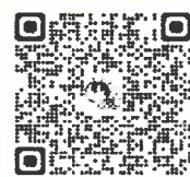
講座申込 QR コード