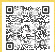
講座申込 QR コード

○ 問い合わせ いわき市生涯学習プラザ ☎0246-37-8888 (電話での申し込みはできません)