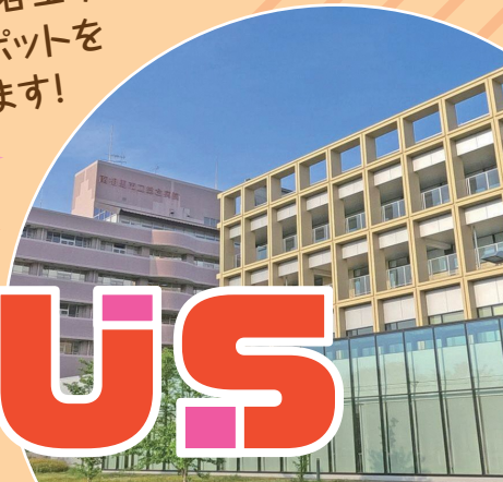
南相馬市立総合病院

浜通り・会津地方・中通りの各エリアの医療機関と各エリアのとおきスポットをめぐるバスツアーを開催します!