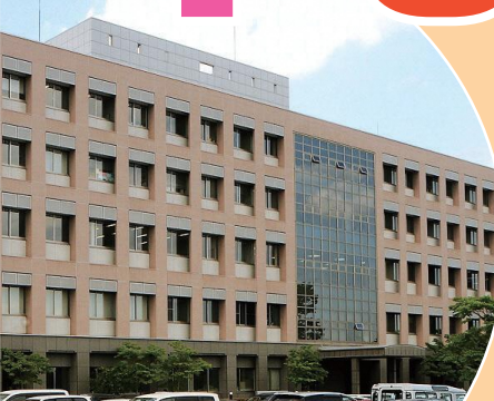
福島県立医科大学 8号館