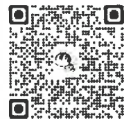
講座申込 QR コード