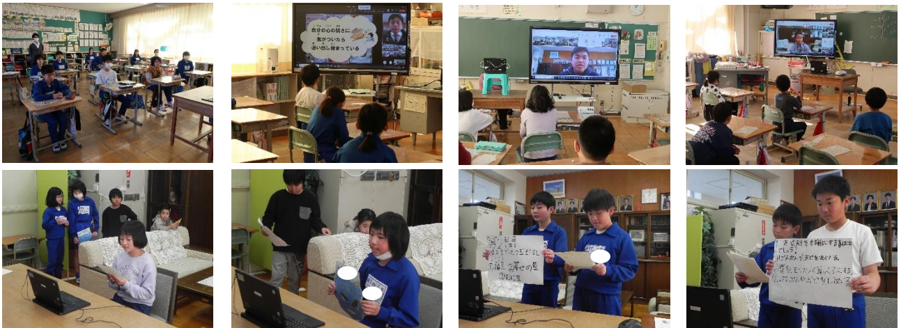
※「節分集会」をMicrosoft Teamsを使って、オンラインで行いました。

「夏井っ子のこころの鬼」を、子どもたちが自分の力で追い出せることを願っています。