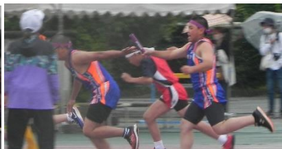
4×100m リレー 第4走者 ○○○○ 第3走者 ○○○○