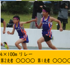
4×100m リレー 第2走者 ○○○○ 第1走者 ○○○○