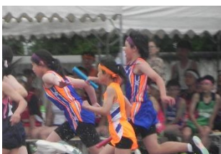
4×100m リレー 第4走者 ○○○○ 第3走者 ○○○○