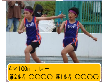
4×100m リレー 第2走者 ○○○○ 第1走者 ○○○○