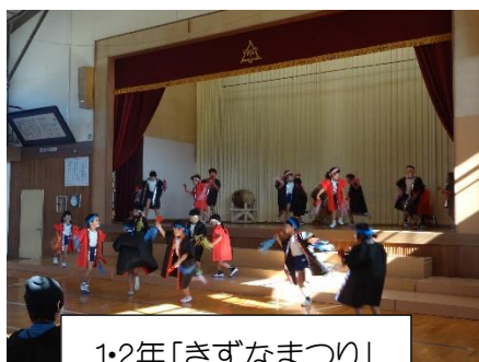
1・2年「きずなまつり」