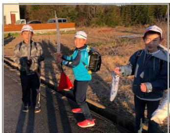
<いざ勝負。つらら剣!>