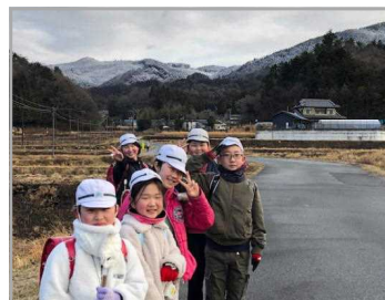
<雪の東山をバックに>