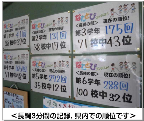
<長縄3分間の記録、県内での順位です>

ご家庭でも是非、話題にして褒めてあげてください。順位や回数を競うだけでなく、なわとびそのものが全身運動となり、子ども達の体力を高めます。大会まであと1ヶ月弱。もうすぐ係より、大会の学年毎の種目や目標回数が発表されます。当日の応援もお時間が許せばお願いします。