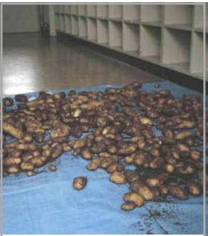
<6年ジャガイモ大豊作>

長期予報では、夏休み(8月)は好天が続くとか!?, 昨年度のような猛暑は御免被りたいところですが、やっぱり夏は暑くなくちゃいけません。低温続きでは、地域の産業でもある稲作や畑作への影響も懸念されます。終業式、子ども達には、一つでいいから、「夏休みにしかできない体験」をするよう伝えるつもりです。保護者の皆様には、どうぞご協力くださいますよう、お願いいたします。