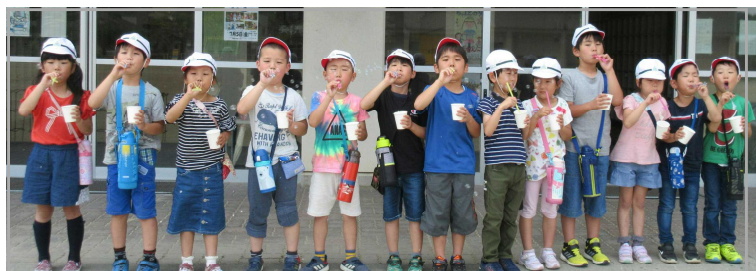
<シャボン玉、飛んでけー> ~生活科の学習より~