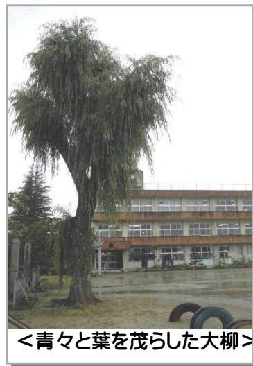
<青々と葉を茂らした大柳>

等、わずか69日間の中に、様々な内容をぎゅっと詰め込んだ充実した1学期でした。普段の学習でも、児童一人一人の実態に合ったきめ細やかな指導、ペアやグループでの学習を中心とした主体的、対話的な授業を心がけてきました。特に、算数科においては共同研究の柱として、力を入れて進め出したところです。