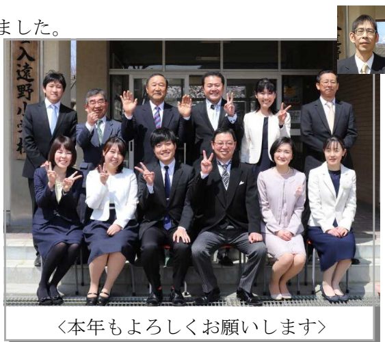
<本年もよろしくお祈いします>