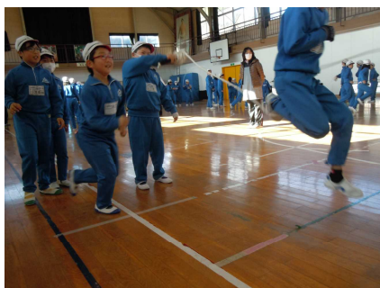
<タイミングを合わせて>