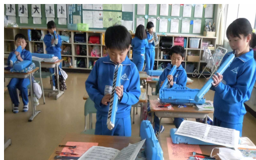
<新鼓笛隊・休み時間の自主練習にも力が入ります。>