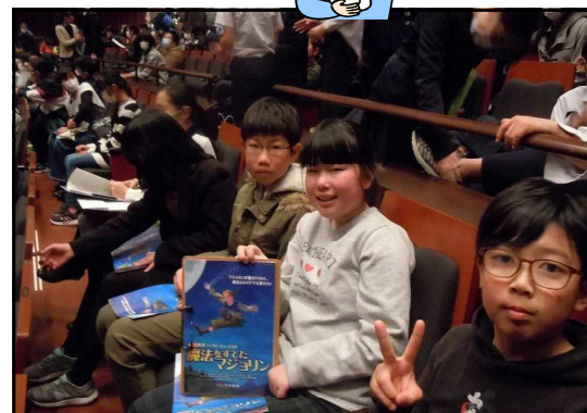
<ドキドキ開演5分前!>

また、まだ避難生活を余儀なくされたり、ふるさとに帰ることができずにいたりする子ども達がいることについても、対岸の火事とせず、児童に伝えていきたいと思えます。