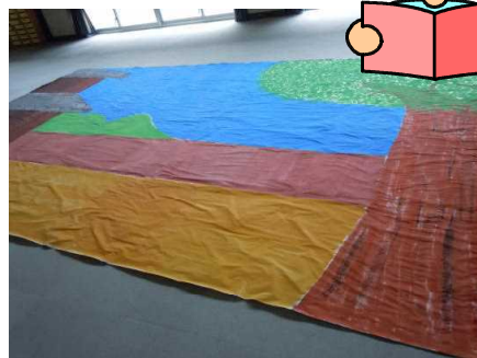
<6年生手作りの壁画>

その他、全体合唱では「ビリーブ」「カントリーロード」の2曲を準備しています。みなさんどうぞ一緒に口ずさんでみてください。