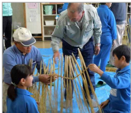
<なわもじりの授業より>