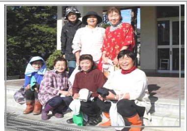
<婦人会のみなさん>