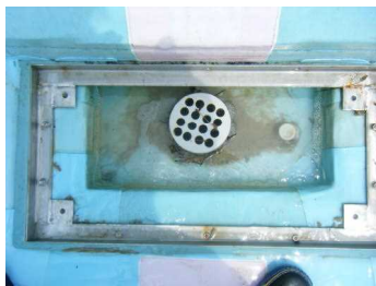
排水溝の安全確認

5月30日(火)には、5・6年生によるプール清掃が行われました。9ヶ月あまり使われなかったプールも、児童のおかげできれいになりました。まもなくプールの授業が開始されます。事故の無いように、十分気をつけていきたいと思ひます。