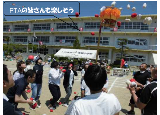
PTAの皆さんも楽しそう